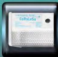
Interruptor de Prueba

CAPACIDAD: Módulo de 9 ó 18 LED's de 1 W c/u (dependiendo del modelo) Potencia total: 9 y 18 W respectivamente